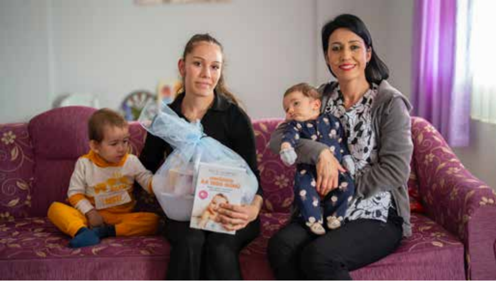
Milas Belediyesi "Hoş Geldin Bebek Projesi" ile 7 yılda toplam 5 bin 598 aileye ulaştı